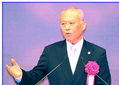
舛添東京都知事挨拶