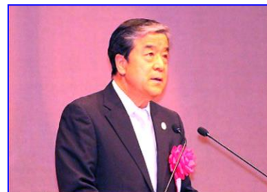
福地 Uクラブ会長挨拶